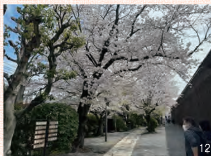
10 アイビースクエアレンガ造りの門 11 門をくぐると、建物入口 12 アイビースクエア内の桜。この時期はとてもきれいです。

ケットを確保した方がいいですね。また、白鳥が優雅に泳いでいる姿を見ることがもできます。