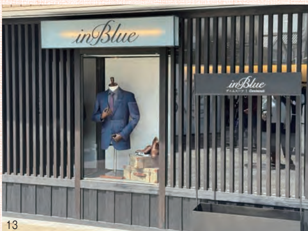
13 in Blue 14 in Blue入口

つ観光施設です。私も時々ランチに行きますが美味しいですよ。ホテルの前にクラシックカーが何台も止まっていたのを見たことがあります。絵になりますね。また、倉敷紡績所が日本の産業の近代化に大きく貢献したとして、工場の建物群が国の近代化産業遺産に認定されました。