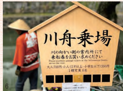
3 倉敷美観地区の中心を流れる倉敷川 4 倉敷川に川船が浮いています。 5 船頭さんが漕いでくれます。 6 船乗り場。早めのチケット確保。 7 桜と川船 8 白鳥 9 桜と白鳥