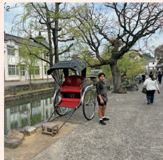
2 倉敷川の川沿いの道には人力車も走っています。利用している人は多いです。

両岸に柳並木が続く倉敷川は、美観地区の中心部を悠然と流れていきます。船頭が漕ぐ川船に観光客が乗船することができ、水上からの景色を楽しむことができます。価格もお手頃ですしお勧めですが、旅行シーズン中はすぐに売り切れてしまうので、早めにチ