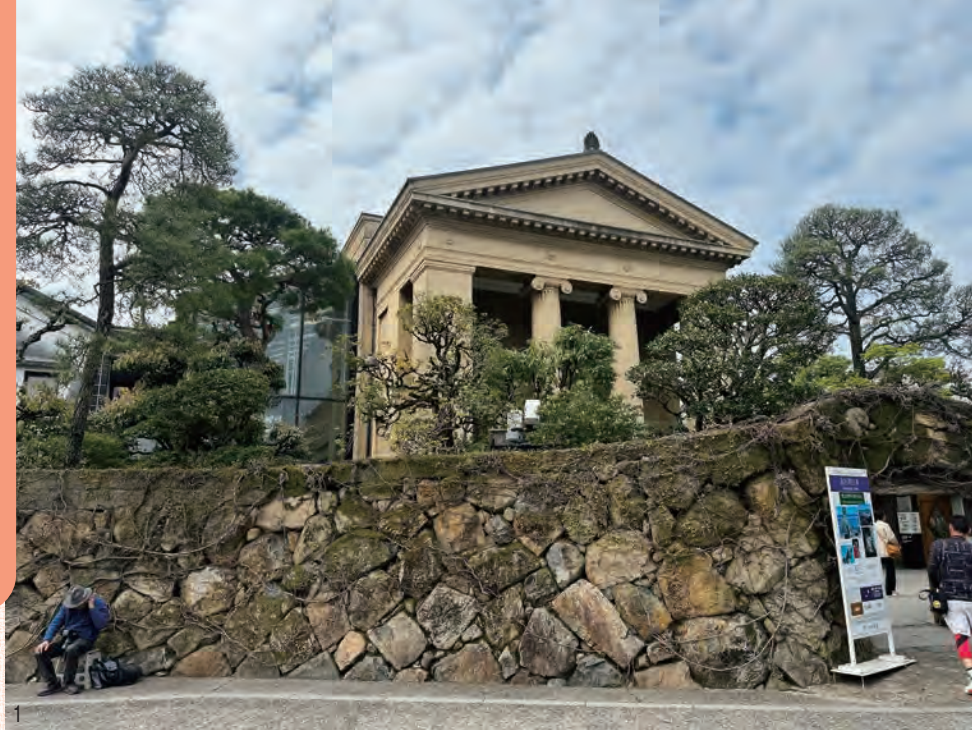
1 大原美術館。倉敷に来られた際は、是非お立ち寄りください。

岡山県は中国地方東部に位置する県であり、県庁所在地は岡山市。倉敷市は岡山県第二の都市です。瀬戸内海に面しており温暖な気候で、白桃やマスカットなどのフルーツの栽培でも有名です。今回の「ふるさとじまん」では、倉敷美観地区の魅力についてご紹介していきます。