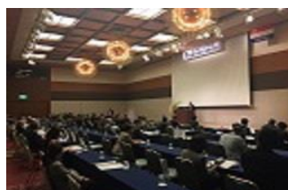
【 報告会 】