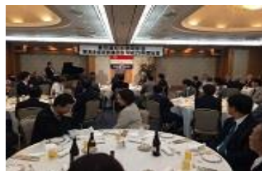
【 懇親会 】