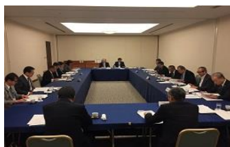
【 総会 】