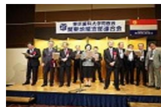
【 校歌斉唱 4番まで！！】