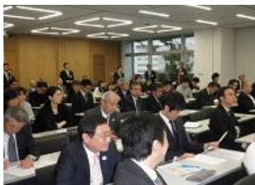
【第4回若手支援セミナー】