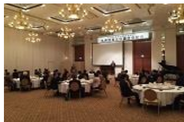
【 総会・懇親会 】