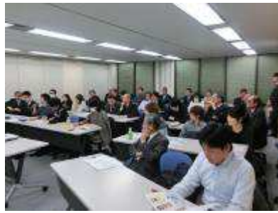
リベラルアーツ・リレー講座③