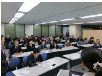
リベラルアーツ・リレー講座②