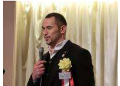
室伏広治教授 (医歯大)