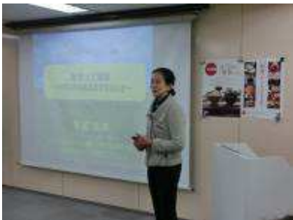
リベラルアーツ・リレー講座①