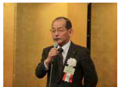
高橋哲夫東京都歯科医師会会長