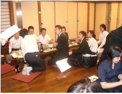
若手学年代表者との懇親会①