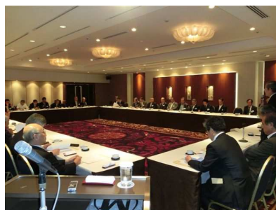
日歯役員・代議員・都道府県歯 会長との懇談会②