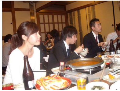
若手学年代表者との懇親会②