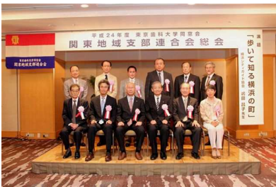
関東地域支部連合会