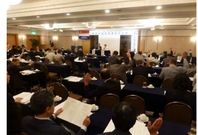
関東地域支部連合会総会