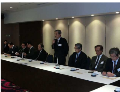
日歯役員・代議員・都道府県歯 会長との懇談会①