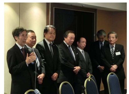
日歯役員・代議員・都道府県歯 会長との懇談会③