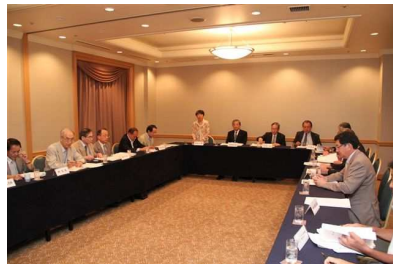
関東地域支部連合会支部長会