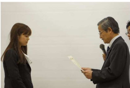
エレクトィブスタディ表彰④