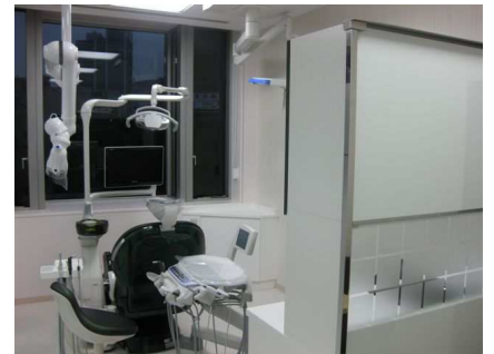
インプラント科(診療室)