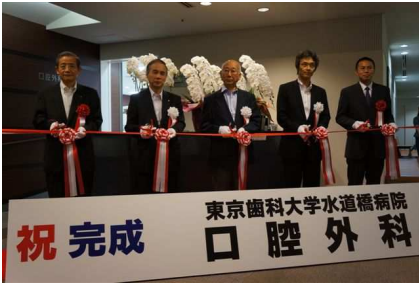
口腔外科 (完成テープカット)