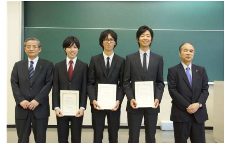
エレクトィブスタディ表彰③