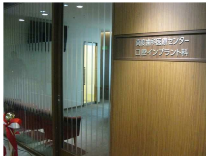
口腔インプラント科(受付)