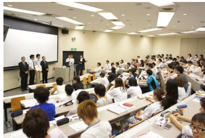
エレクトィブスタディ表彰②