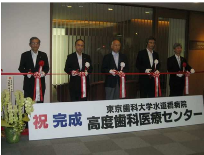
高度歯科医療センター (完成披露テープカット)