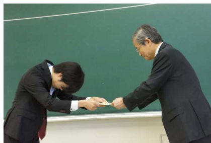
エレクトィブスタディ表彰⑤