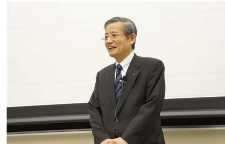
矢崎会長からの激励の挨拶