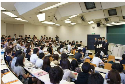
エレクトィブスタディ表彰①