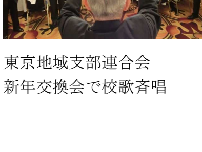
東京地域支部連合会 新年交換会で校歌斉唱