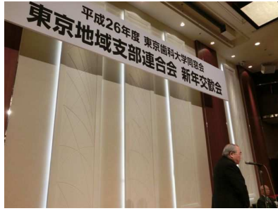
東京地域支部連合会 新年交換会で浮地会長挨拶