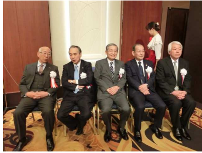
東京地域支部連合会 新年交換会のご来賓