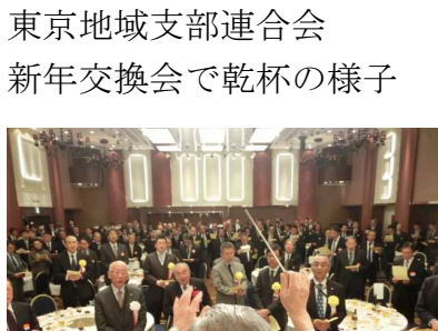
東京地域支部連合会 新年交換会で乾杯の様子