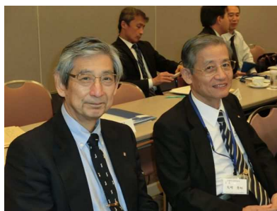
矢崎会長（右）と宮地副会長