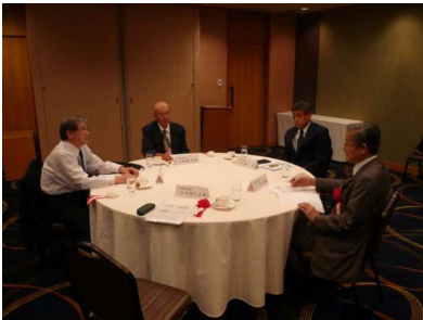
北陸地域支部連合会支部長会