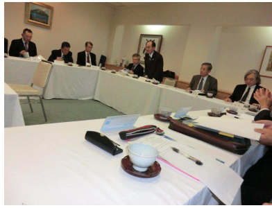
九州地域支部連合会支部長会