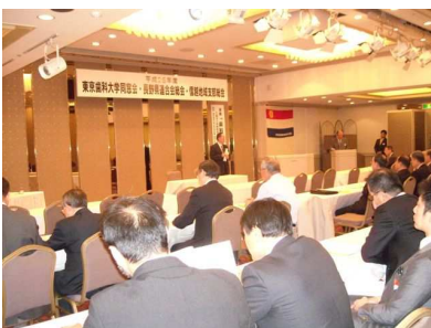
信越地域支部連合会総会