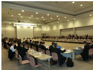
第60回全国歯科大学 同窓会・校友会懇話会