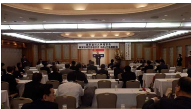
東海地域支部連合会総会