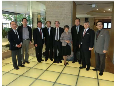
関東地域支部連合会支部長会