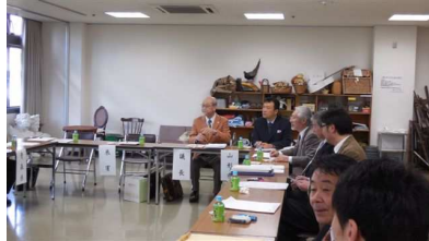
東北地域支部連合会支部長会