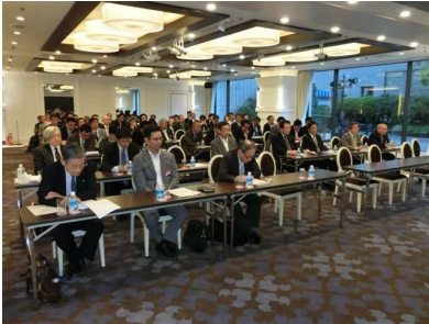
全国社会保険指導者研修会