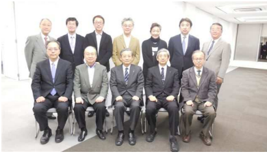
同窓会創立 120 周年記念 事業準備委員会