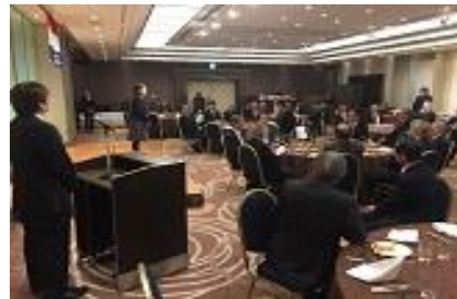
【 懇親会 】