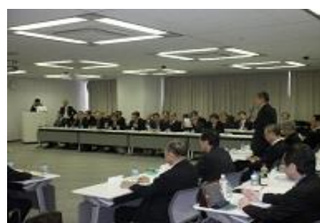
【 都道府県代表者会 ② 】