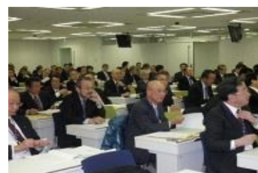
【 評議員会 】