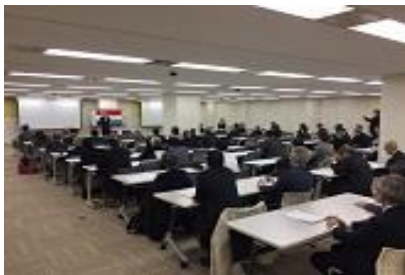
【 東京地域支部連合会総会 】

・ 懇親会 ：「ホテル メトロポリタンエドモンド」へ会場を移して盛大に開催されました。