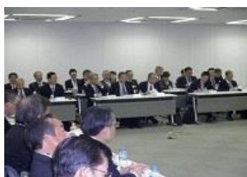
【 都道府県代表者会 ① 】

・ 懇親会 ：評議員会終了後、水道橋校舎西棟ラウンジにおいて懇親会が行われました。