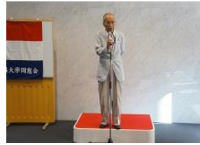
【大先輩の貴重なお話です。】