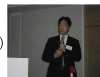
【 講師陣 】