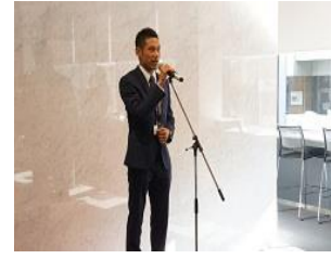
【・・・新卒!・・・】