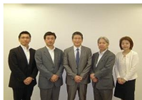
【 講師を囲んで 】