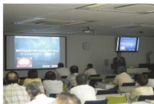
【 講演会 】