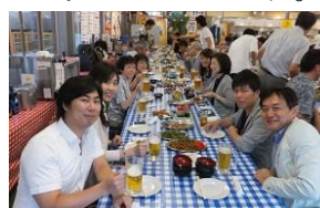
【 ビアパーティー 】