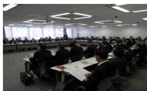
【都道府県代表者会】

・ 懇親会 ：評議員会終了後、水道橋校舎西棟ラウンジにおいて懇親会が行われました。