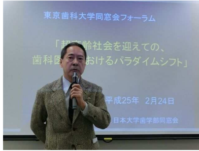
小幡 日大歯学部同窓会 会長代行挨拶