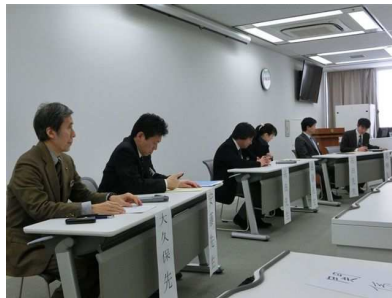
ディスカッション②