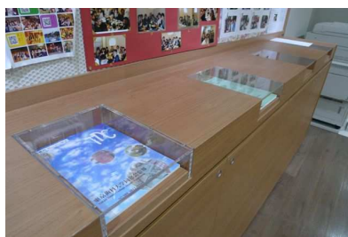
「さいかち坂校舎」 エントランスホール