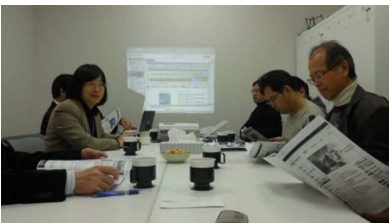
大学との HP 関係打合せ