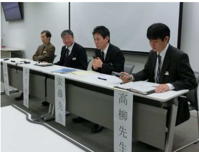
ディスカッション①