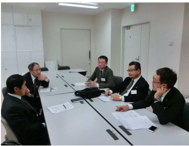
ゴルフ大会委員会