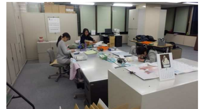
同窓会室(事務スペース)