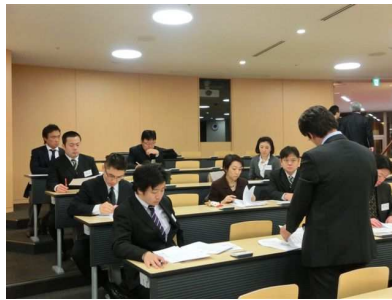
臨床セミナー委員会