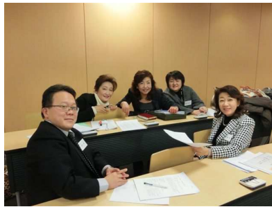
若手ネットワーク委員会