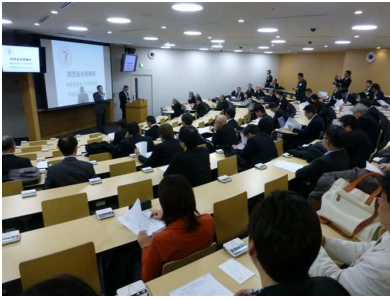
常置委員会・全体委員会