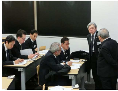
社会保障制度研究委員会